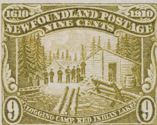
1610-1910, CAMP DE BÔCHERONS AU LAC RED INDIAN, TERRE-NEUVE ET LABRADOR /