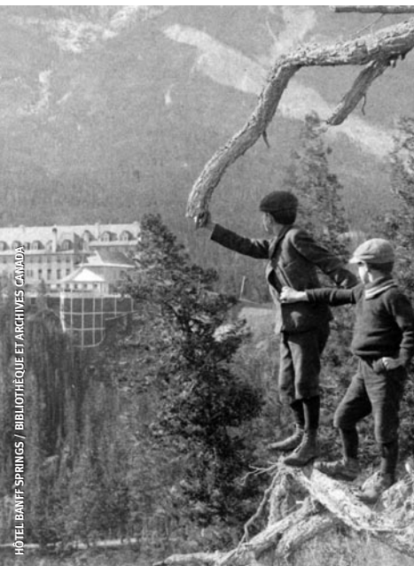
HÔTEL BANFF SPRINGS

Comprendre le passé pour façonner un meilleur avenir.