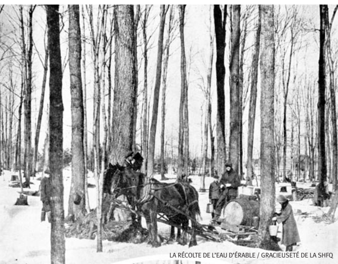
LA RÉCOLTE DE L'EAU D'ÉRABLE / GRACIEUSÉTE DE LA SHFO

Le Projet canadien de préservation de l'histoire forestière est un effort concerté entre le Service canadien des forêts, la Forest History Society (Société d'histoire forestière) (FHS) et la Nouvelle initiative canadienne en histoire de l'environnement (NiCHE). Nous partageons l'objectif de sauvegarder l'histoire de la forêt du Canada. Son but est d'identifier les collections qui risquent de se perdre et de faciliter leur dépôt dans des centres d'archives canadiens reconnus. Alors que notre regroupement a toujours été préoccupé par la protection des archives historiques et leur accessibilité, actuellement nos efforts sont mis en place pour parer aux risques réels et pressants de perdre des archives importantes dans le contexte où l'on assiste à plusieurs regroupements au sein de l'industrie forestière et au vieillissement de la population. Nous invitons toute personne ou institution intéressée par l'histoire de la forêt à nous aider à localiser tout document ou collections méritant d'être préservés ainsi que des centres d'archives qualifiés où ils pourraient être conservés.